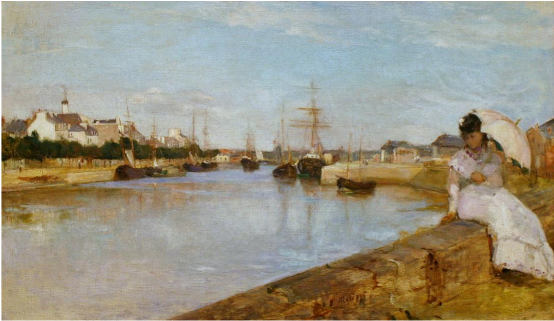
Berthe Morisot, Vue du petit port de Lorient (1869) Huile sur toile, 43,5 × 73 cm, National Gallery of Art, Washington

Seizième rencontre annuelle de l'Association canadienne d'études francophones du XIX e siècle